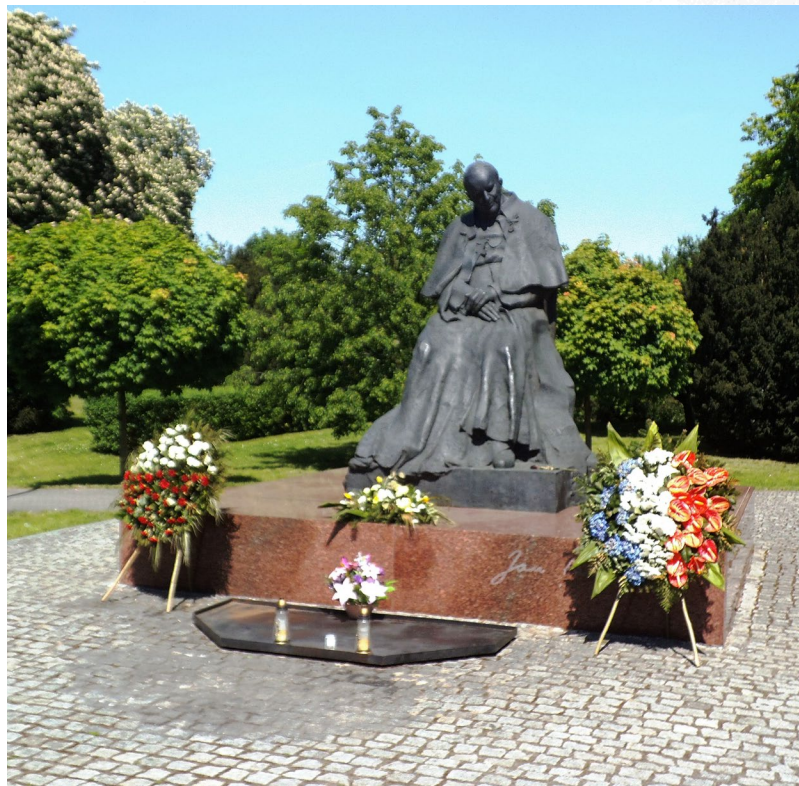
Pomnik w Toruniu