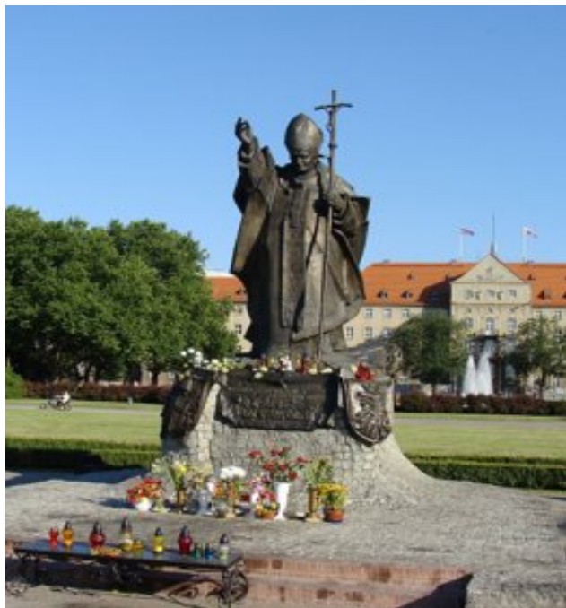
Pomnik w Szczecinie