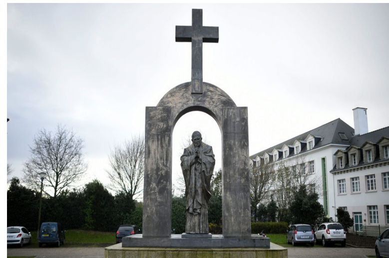
Pomnik w Rzeszowie