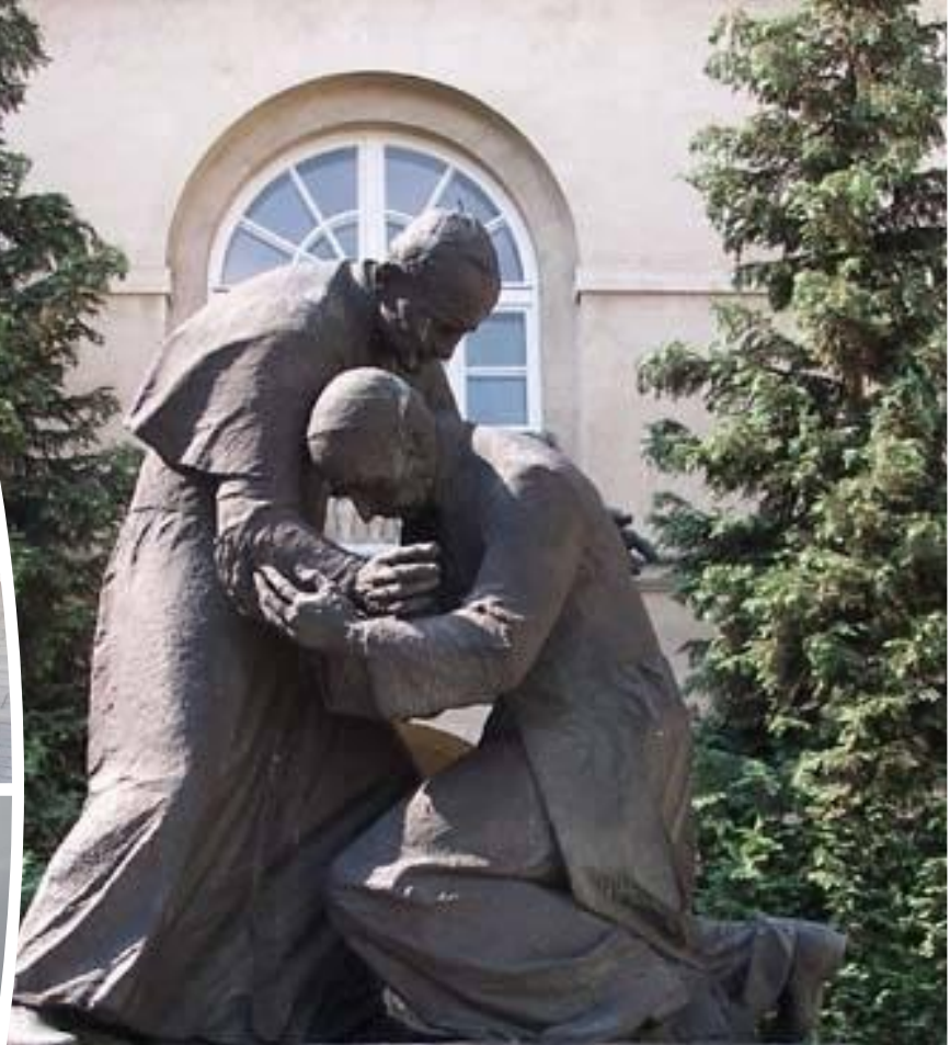
Pomnik w Częstochowie