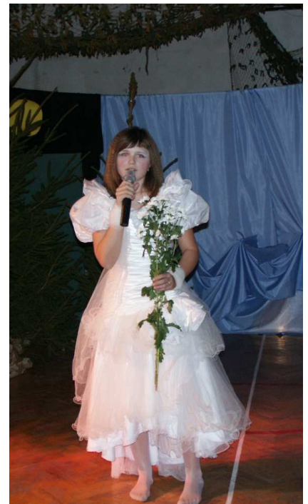
Maryla z ballady „To lubię”