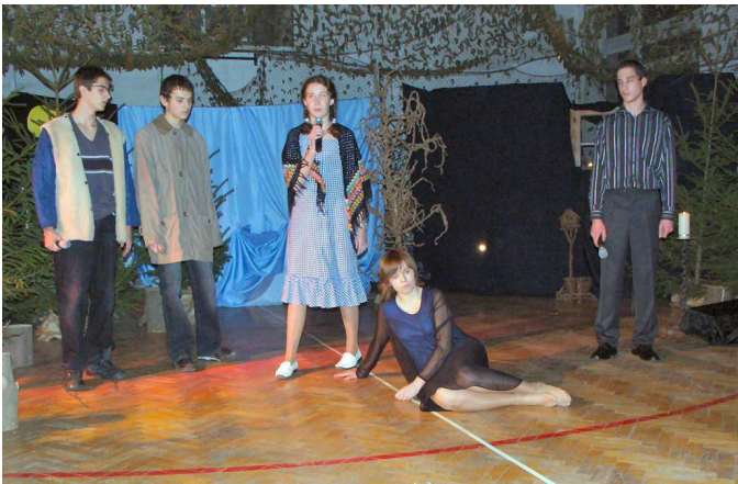
Scena z ballady „Romantyczność”