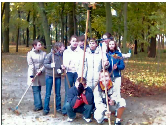
Dzielna załoga z 3 d