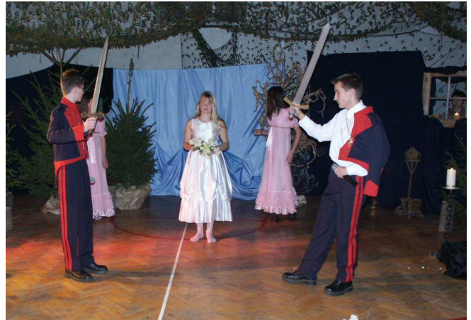
Pojedynek dwóch braci z ballady „Lilie”