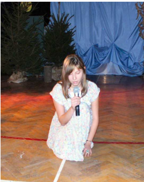
Porzucona dziewczyna z ballady „Rybka”