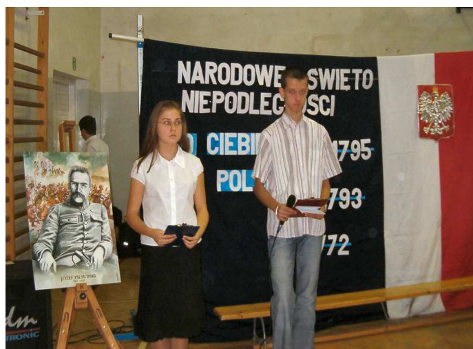
Narratorzy widowiska przygotowanego z okazji Święta Niepodległości