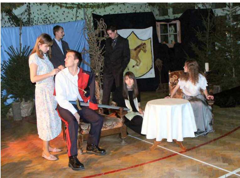
Jaka to ballada...?