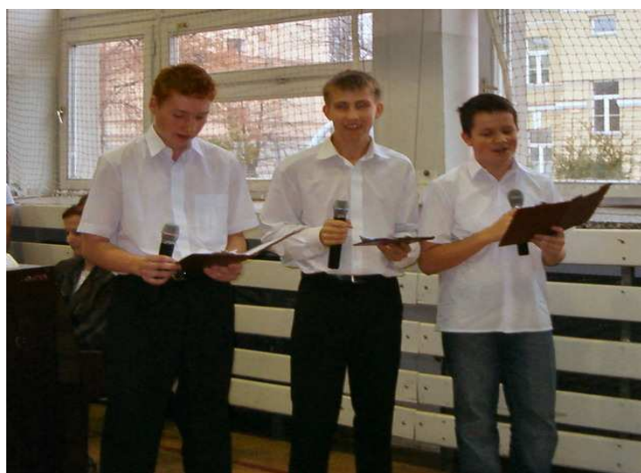
Trzech tenorów z III i