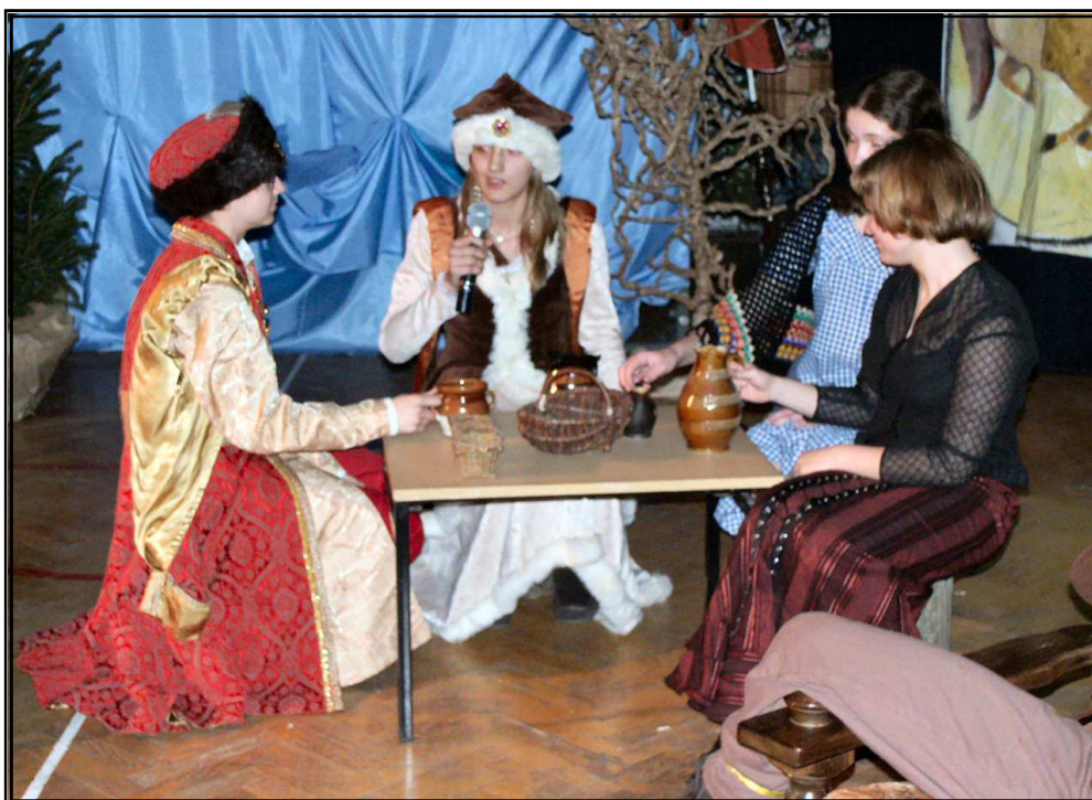
Scena z ballady „Pani Twardowska”

GAZETA SPOŁECZNOŚCI SZKOLNEJ PUBLICZNEGO GIMNAZJUM NR 1 W SIEDLCACH IM. KOMISJI EDUKACJI NARODOWEJ