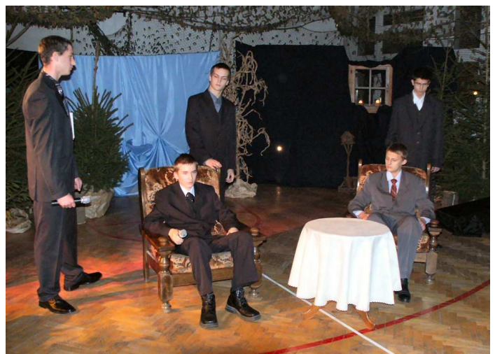
Dyskusja literacka romantyków z klasykami

„Romantyczność” jest utworem otwierają- cym cykl ballad i romansów. Ta ballada również ja- ko pierwsza została zaprezentowana przybyłej pu- bliczności. Poeta nawiązuje w niej do ludowych wie- rzeń o możliwości kontaktowania się ludzi żywych z duchami zmarłych. Nastrojowość i atmosfera pełna tajemniczości jest charakterystyczna dla epoki.